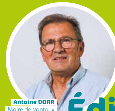
Antoine DORR Maire de Vantoux Conseiller délégué à la Gestion des milieux aquatiques et à la prévention des inondations