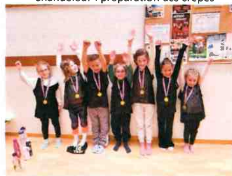
Rencontre sportive grande section / Cours primaire