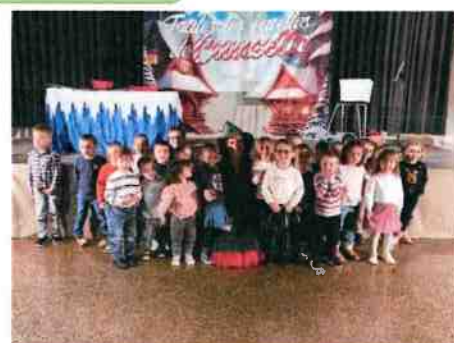
Spectacle de Noel