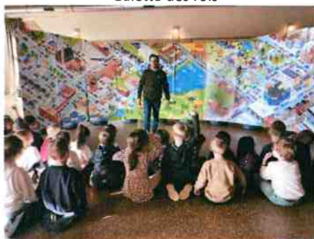
Formation au tri des déchets par l'Euro-Métropole de Metz