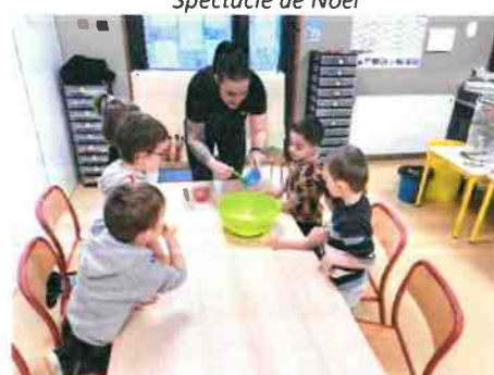
Chandelier : préparation des crêpes