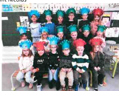
Galette des rois