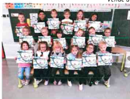
Distribution des livres offerts par la commune