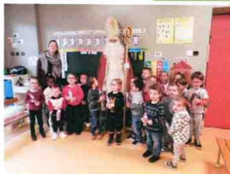
Venue de Saint Nicolas